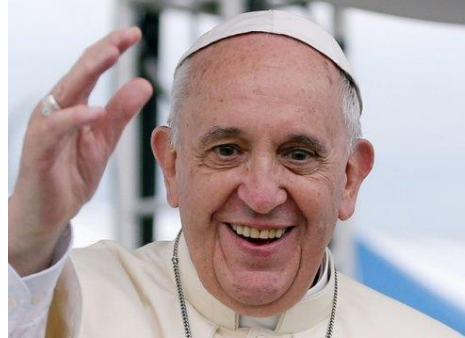
Na sliki: papež Frančišek

Jezus se ne pogovarja s hudičem, nikoli se ni z njim pogovarjal. Ali ga je nagnal ali pa ga obsodil, a nikoli se ni pogovarjal. V puščavi mu ne odgovarja s svojo besedo, ampak z Božjo besedo. Bratje, sestre, nikoli se ne pogovarjajte s hudičem. Ko pride s skušnjavami – »to bi bilo lepo, tisto bi bilo lepo« – se ustavite. Dvignite svoje srce h Gospodu, molite k Mariji in hudiča naženite stran, kot nas je to naučil Jezus."