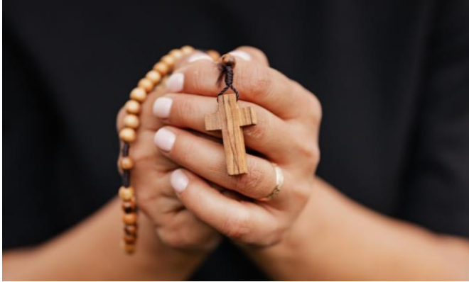
Na sliki: Simbol molitve rožnega venca

Vsakemu izmed nas, tako sem prepričan, je že poznan znameniti stavek iz prvega pisma Tesaloničanom, v katerem nas sveti Pavel spodbuja: "Neprenehoma molite!"